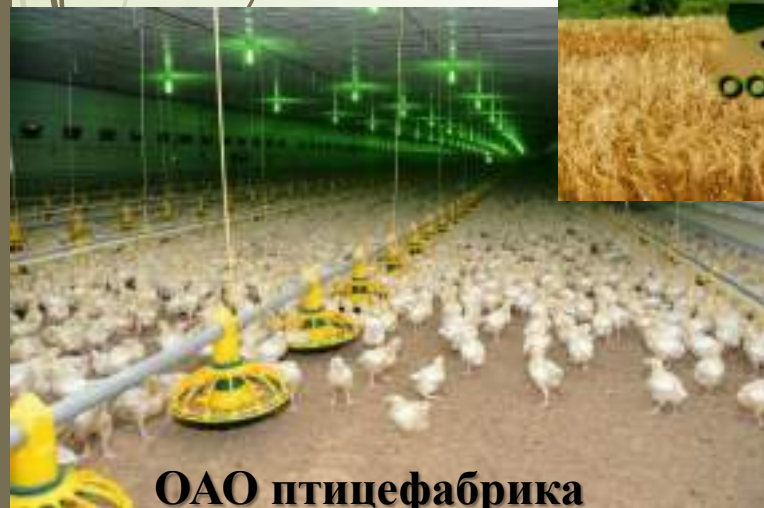
ОАО птицефабрика «Курганинская»