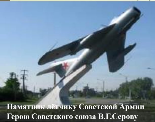
Памятник лётчику Советской Армии Герою Советского союза В.Г.Серову