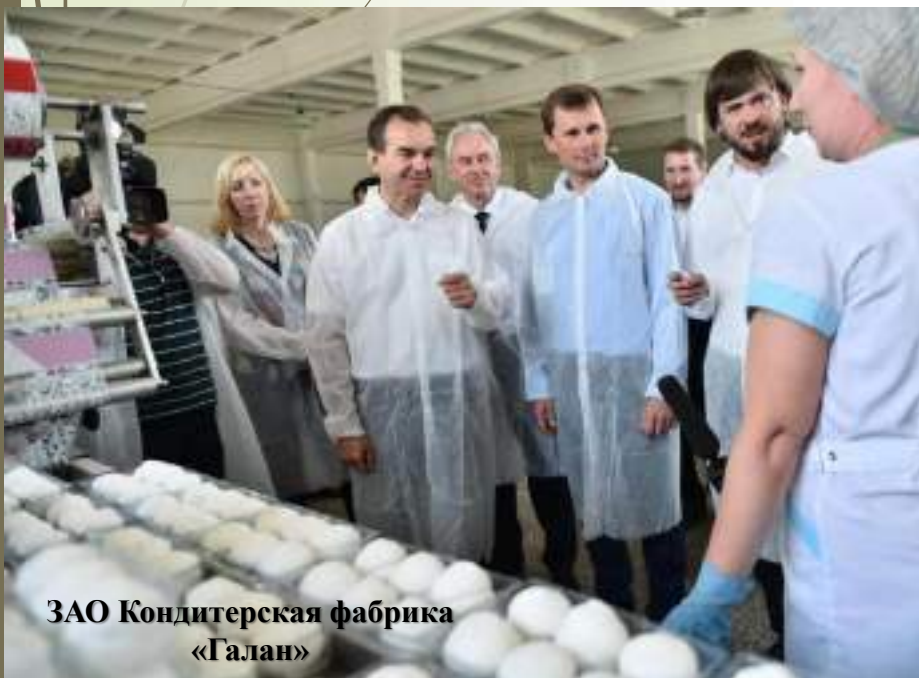
ЗАО Кондитерская фабрика «Галан»