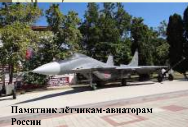
Памятник лётчикам-авиаторам России