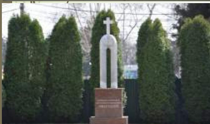
Памятник казакам-основателям станции Курганной