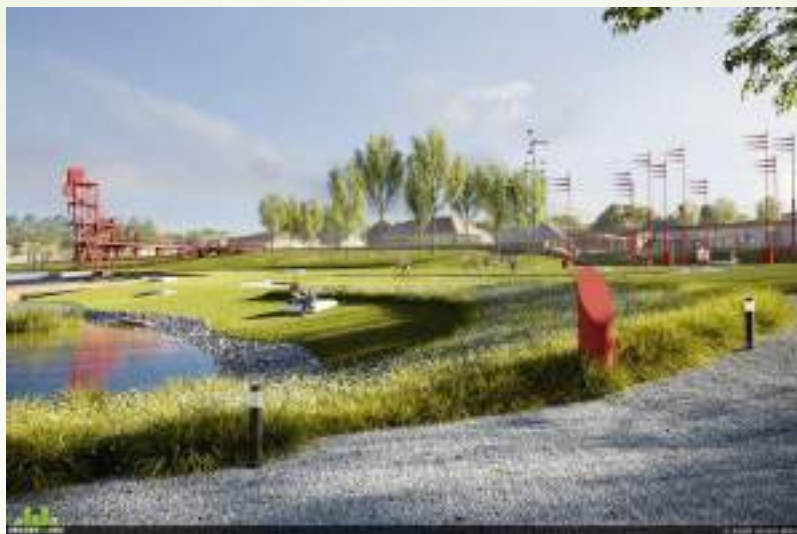
Создание сквера 75-летия Победы