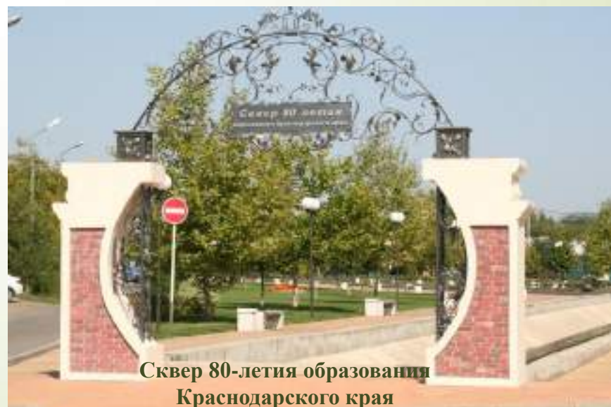
Сквер 80-летия образования Краснодарского края