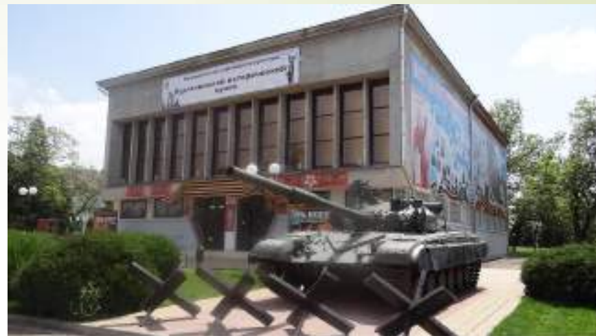
Курганинский исторический музей