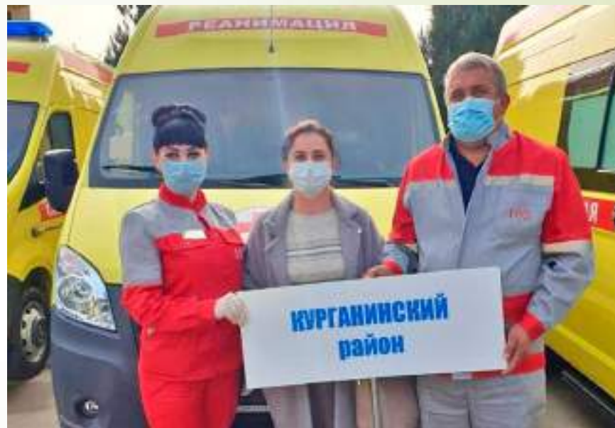
Открытие филиала медицинского колледжа в г.Курганинске