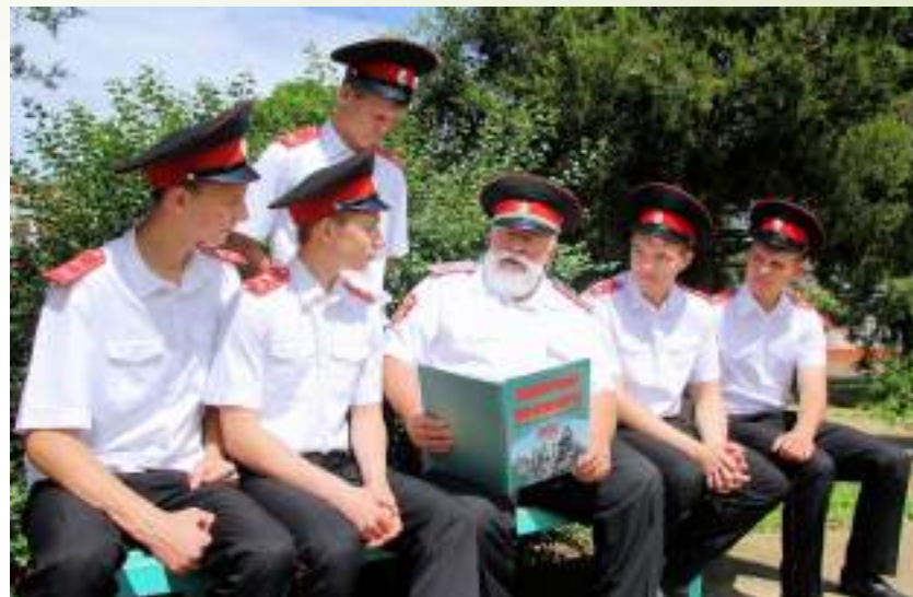
Курганинский казачий кадетский корпус