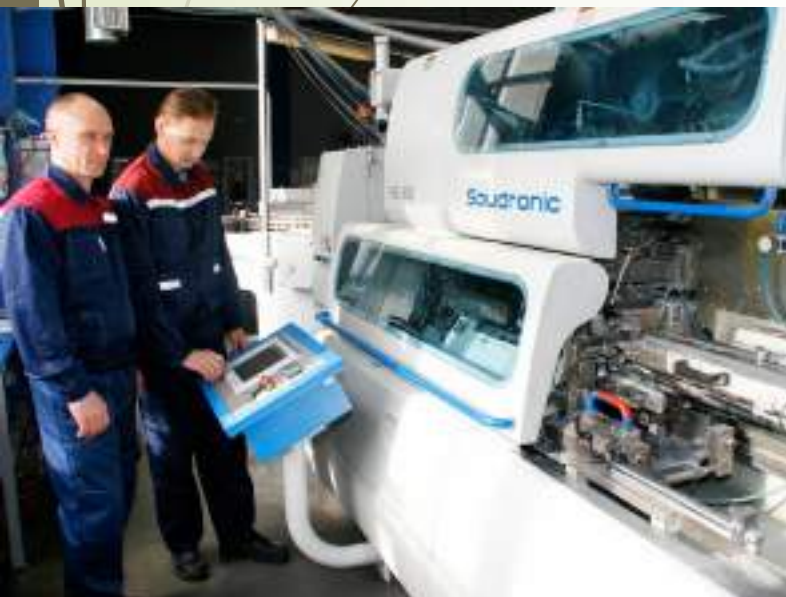
ООО «Метарус» производство ж/б упаковки