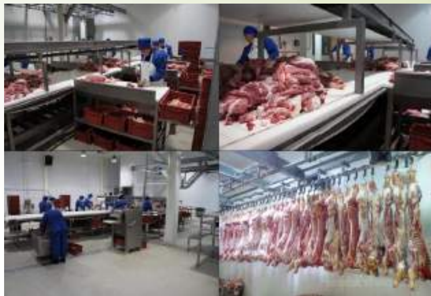
ООО «Кубанский бекон»