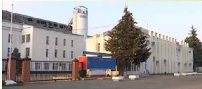
ОАО Сахарный комбинат «Курганинский»