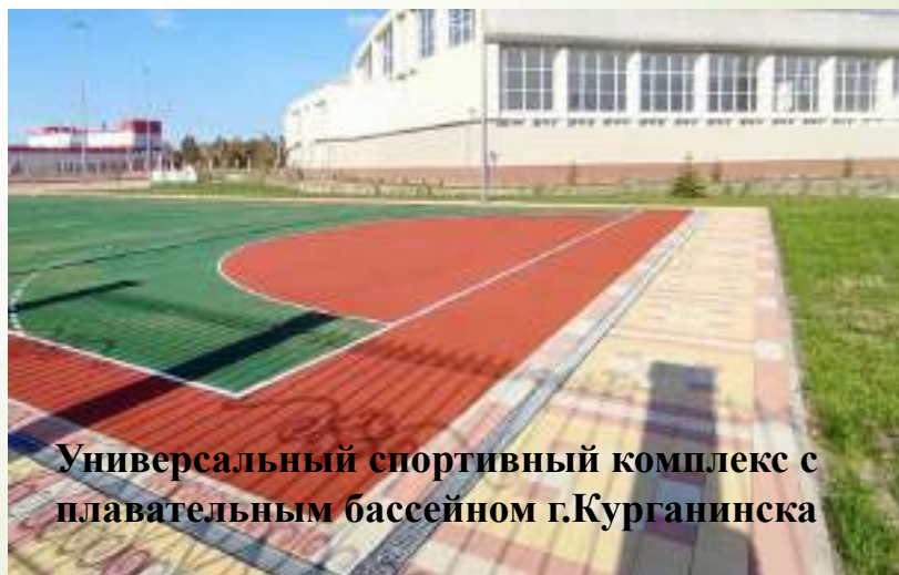
Универсальный спортивный комплекс с плавательным бассейном г.Курганинска