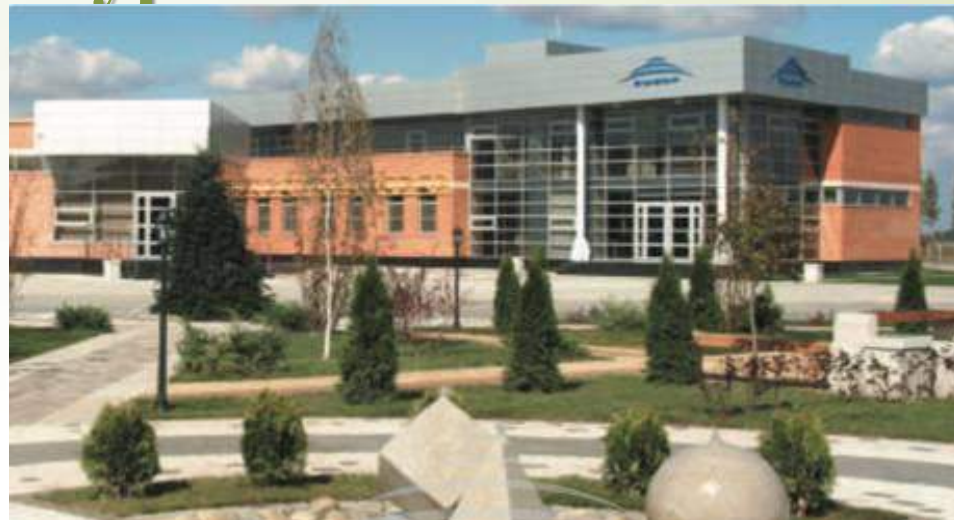
Завод по производству тротуарной плитки «Выбор С»