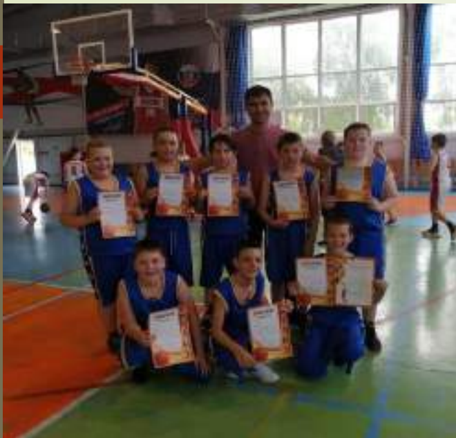
Детско-юношеская спортивная школа г.Курганинска