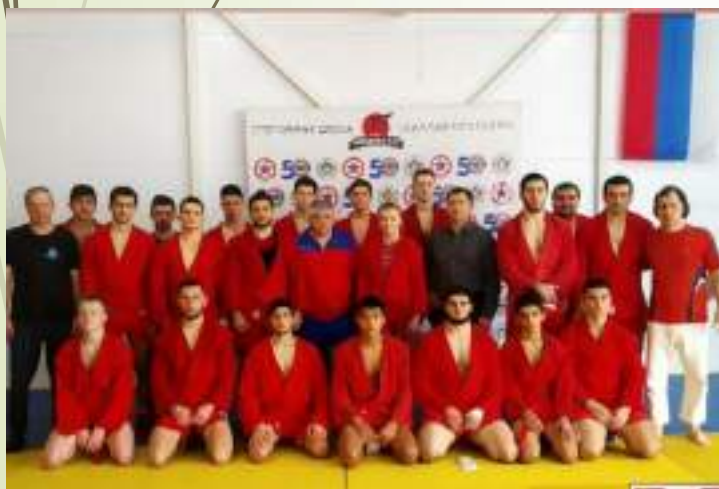
Спортивная школа олимпийского резерва им. Н.И. Нефедова г.Курганинска