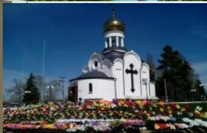
Храм-часовня Петра и Павла