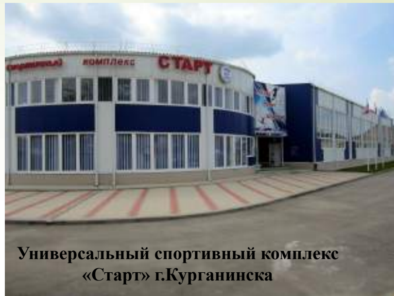
Универсальный спортивный комплекс «Старт» г.Курганинска