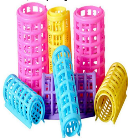
е) «пластиковые бигуди»